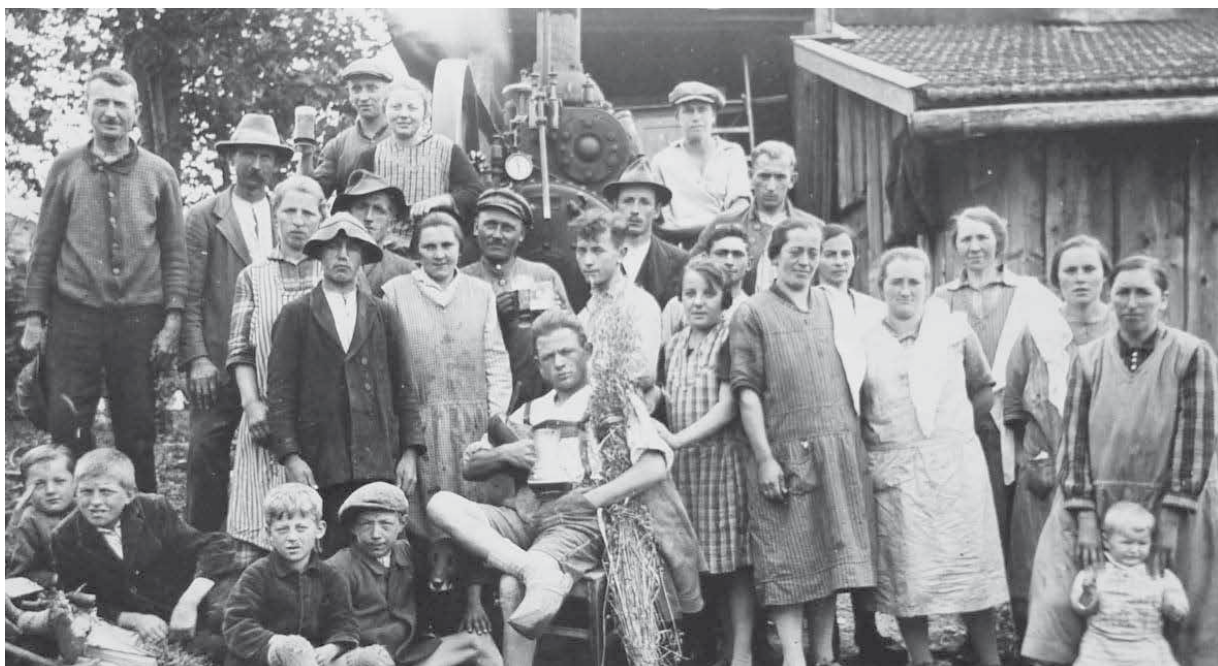
St. Oswald 1940 Dreschen mit dem „Dampf“. Vielleicht kennt ein Leser*in die abgebildeten Personen.