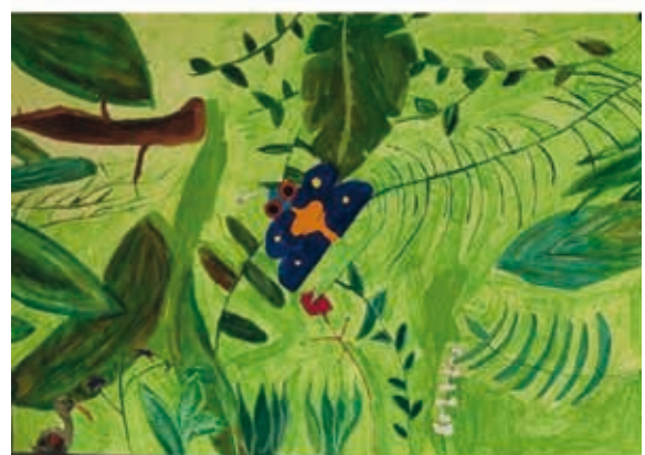
„Namensinsekte“ der 6. Jahrgangsstufe